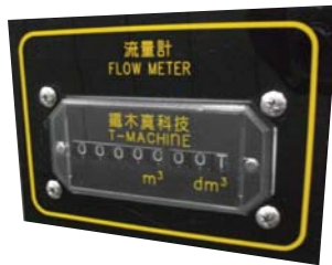
0.001 /m 精密流量計