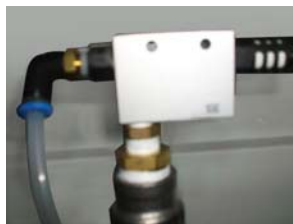
微量負壓抽吸裝置