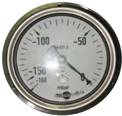
-20 mbar 精密壓力表.